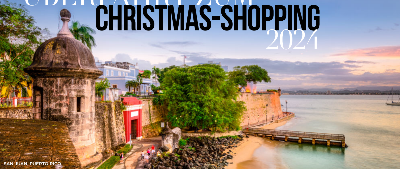
SAN JUAN, PUERTO RICO